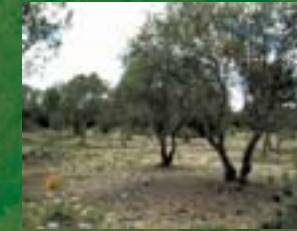
Resalveos y repoblaciones forestales revitalizan e incrementan la rentabilidad del monte mediterráneo.