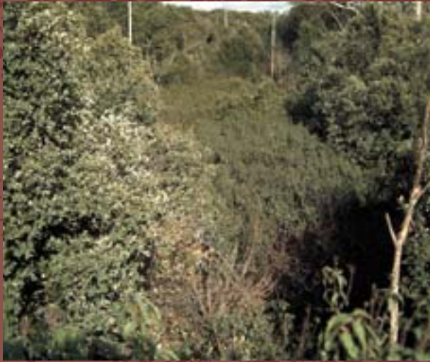
Encinar mediterráneo abandonado

En la actualidad, muchos montes privados de la provincia de Soria carecen de gestión puesto que la rentabilidad económica que se obtiene de ellos es escasa.