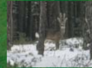
La caza y los pastos suponen anualmente la mayor fuente de ingresos en muchos montes sorianos.